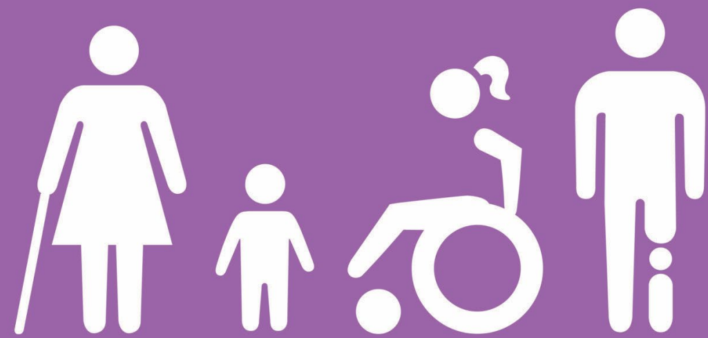
Rättighetssymbolerna framtagna 2019 av DHR tillsammans med The New Division