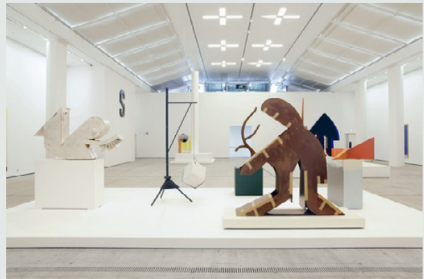
One-Time Pad, BALTIC Centre for Contemporary Art 2012.